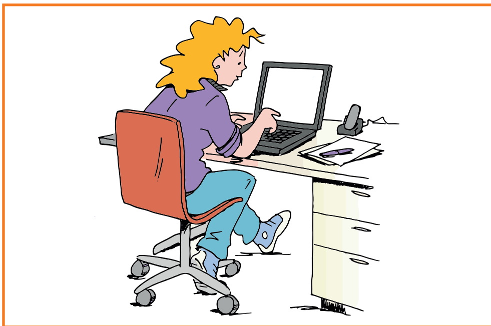
Deze kaart is onderdeel van de Toolkit Blick op LVB