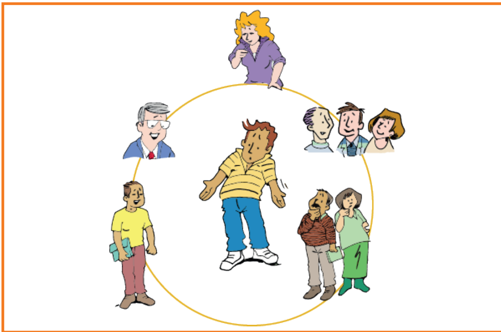
Deze kaart is onderdeel van de Toolkit Blik op LVB