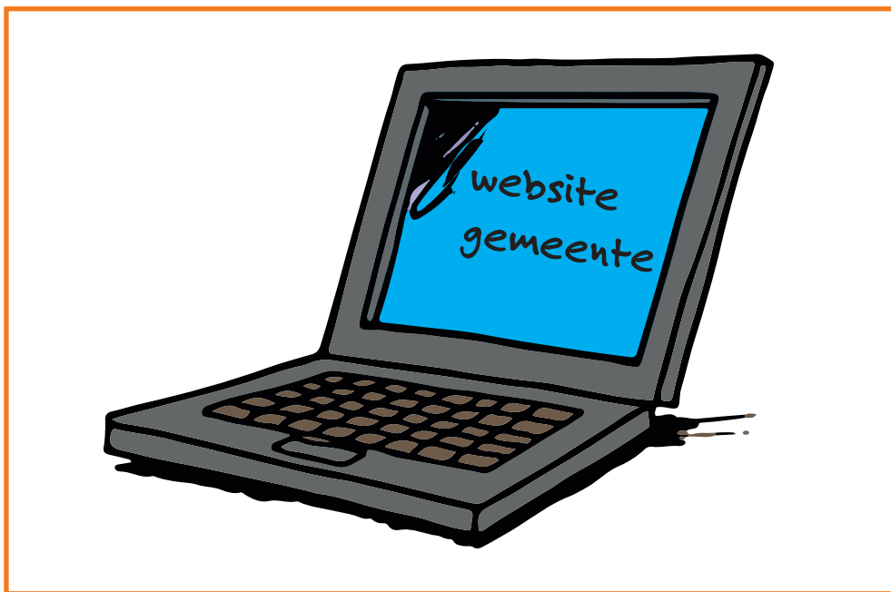
Deze kaart is onderdeel van de Toolkit Blik op LVB