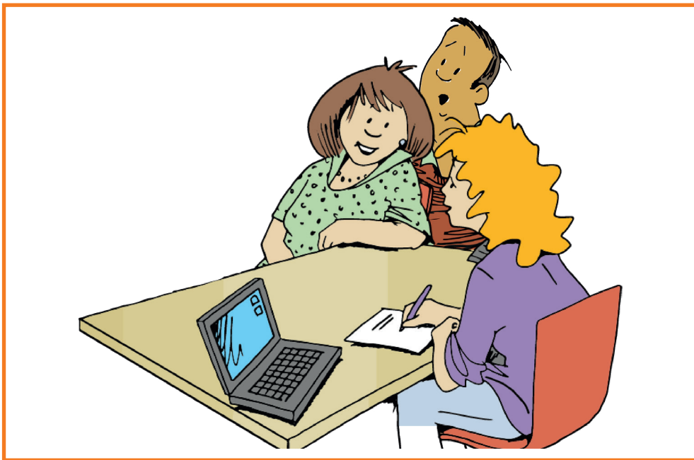
Deze kaart is onderdeel van de Toolkit Blick op LVB