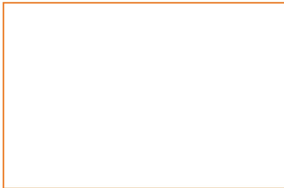
Deze kaart is onderdeel van de Toolkit Blick op LVB