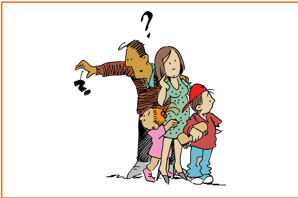
Deze kaart is onderdeel van de Toolkit Blik op LVB