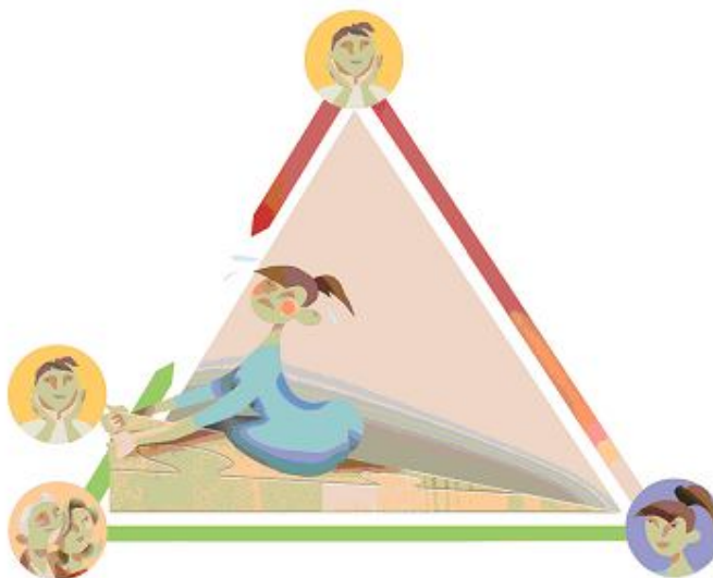
Figuur 3. Twee strategieën in de driehoek

Figuur 3 maakt duidelijk dat begeleiders twee strategieën kunnen kiezen: